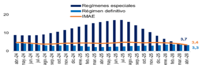
Índice mensual de actividad económica por régimen Variación interanual de la serie tendencia ciclo (en porcentaje)